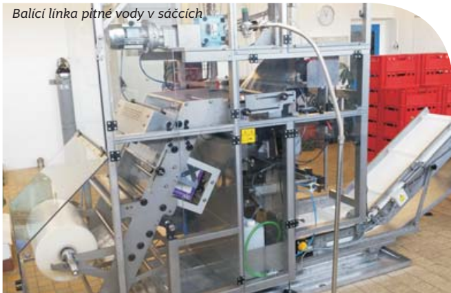
Balící linka pitné vody v sáčcích

Balící linka je instalována v úpravně vody Káraný. Cely proces balení vody do sáčků včetně použité fólie je v souladu se zákonem č. 258/2000 Sb., o ochraně veřejného zdraví a souvisejících předpisů. Potřebné údaje o jakosti pitné vody včetně data spotřeby, jsou uvedeny na sáčku. Jakost vody v sáčcích je průběžně kontrolována akreditovanou laboratoří.