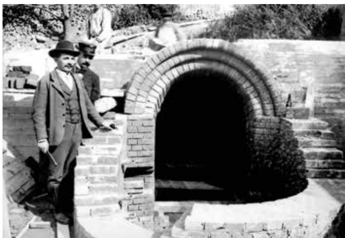
▲ Součástí projektu byla i stavba okružní stoky.