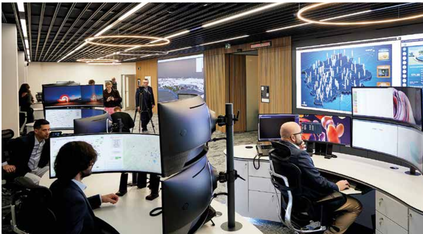
▲ Vzájemně propojené systémy umožňují komplexní sledování a řízení vodohospodářské infrastruktury.

Umělá inteligence pomáhá pražským vodohospodářům řídit provoz, efektivně využívat zdroje vody i energie a šetřit náklady.