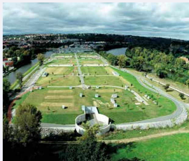
▲ Ústřední čistírna odpadních vod na Císařském ostrově

Klíčovou oblastí z pohledu udržitelnosti je zpracování kalů. V loňském roce bylo vyprodukováno celkem 84 801 tun (v odvodněném a stabilizovaném stavu). Podle principů cirkulární ekonomiky bylo 93 % kalů využito v zemědělství a 7 % kalů zpracováno kompostováním.