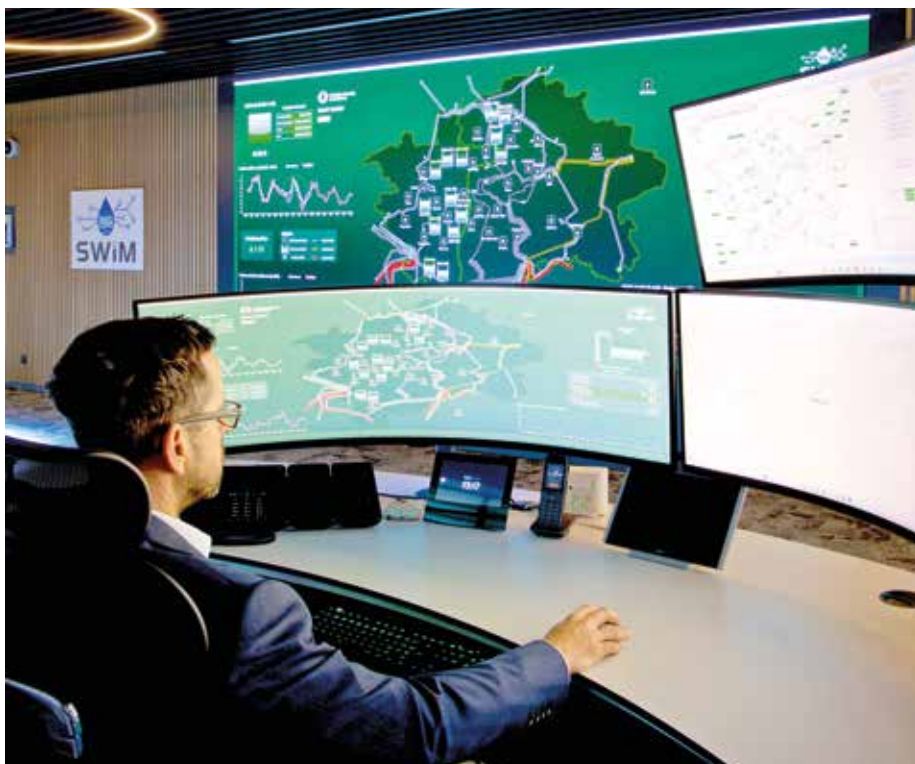
▲ Nový systém je postavený na zcela nové softwarové platformě a přináší řadu vylepšení.